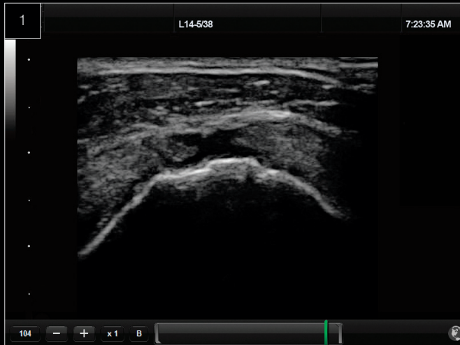
MSK Rottura del tendine sovraspinoso della cuffia dei rotatori.