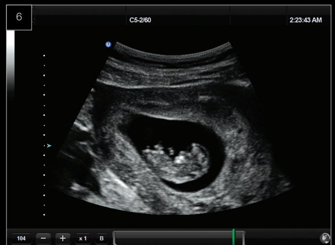
OB/GYN Feto di 10 settimane.