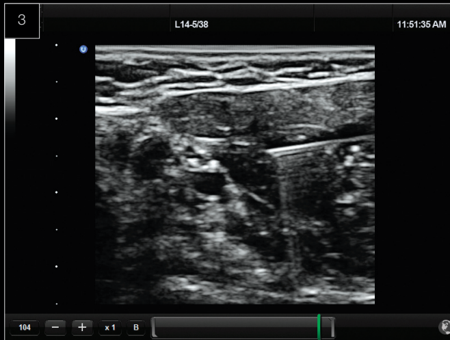
Procedura di orientamento Blocco del nervo interscalenico.