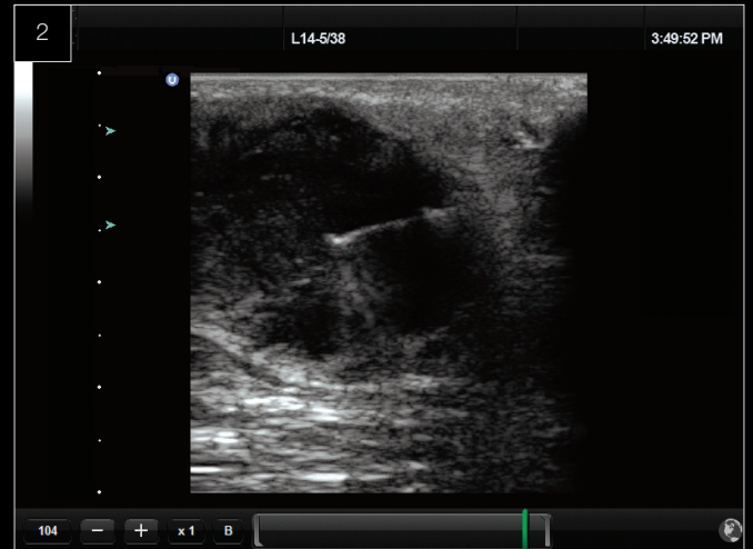
Patologia Aspirazione mediante ago – massa interna al seno.