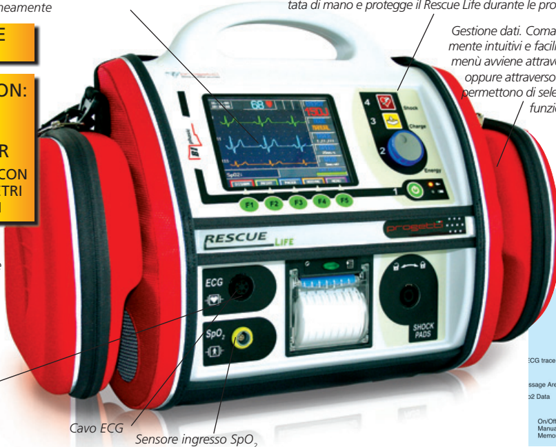
Cavo ECG Sensore ingresso SpO 2

Attacco rapido. L'operatore può scegliere se usare le piastre riutilizzabili o le piastre pregelate monouso per la defibrillazione esterna in modalità AED, ove previsto dal modello. Entrambe sono dotate di singolo innesto rapido con chiusura di sicurezza per una totale affidabilità d'uso.